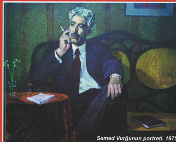
Səməd Vurğunun portreti. 1975