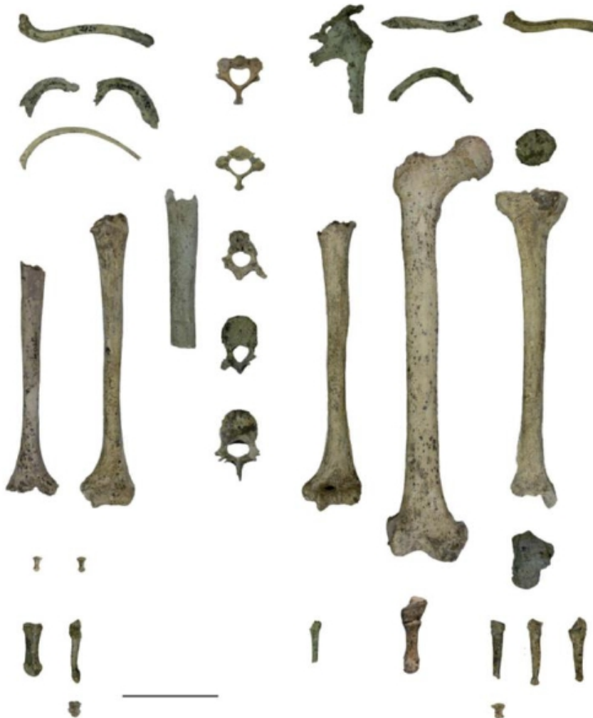
Şəkil 2. Dmanisi məskənindən aşkar olunmuş postkranial sümüklər (Lordkipanidze, Jashashvili, Vekua [et al] // Nature, – 2007.v. 449).