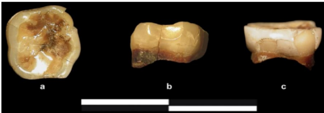
Şəkil. 5. Bondi mağarasından əldə olunmuş insan dişi (V təbəqə). a) okluzal, b) mezial c) bukal (Tushabramishvili V., 2012. v.62, p.5)