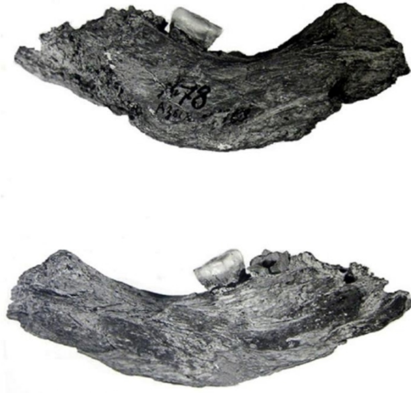
Şəkil .3. Azix çənə qalığı (Mammadov.Y. Azerbaijan Archeology, – 2019, Vol:22, Nuber 1, 2019)