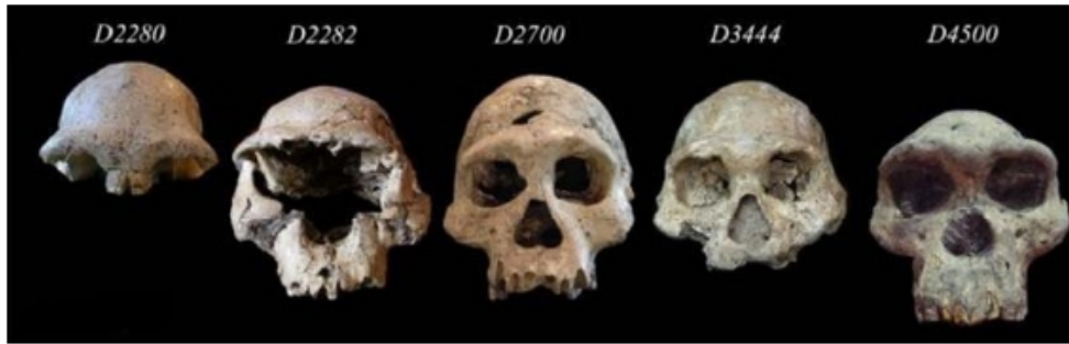
Şəkil 1. Dmanisi məskənindən aşkar olunmuş kəllələr (Hominins [Electronic resource] URL: http://www.dmanisi.ge/page?id=1&lang=en )