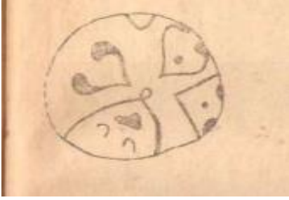
Şəkil 1. (Örənqala)