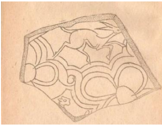
Şəkil 5. (Gəncə)