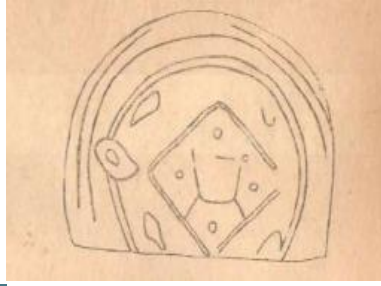
Şəkil 2. (Örənqala)