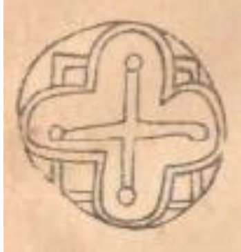
Şəkil 4. (Örənqala)