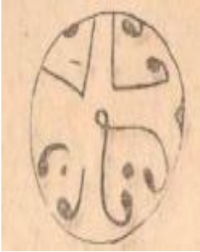
Şəkil 3. (Örənqala)