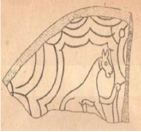
Şəkil 6. (Gəncə)