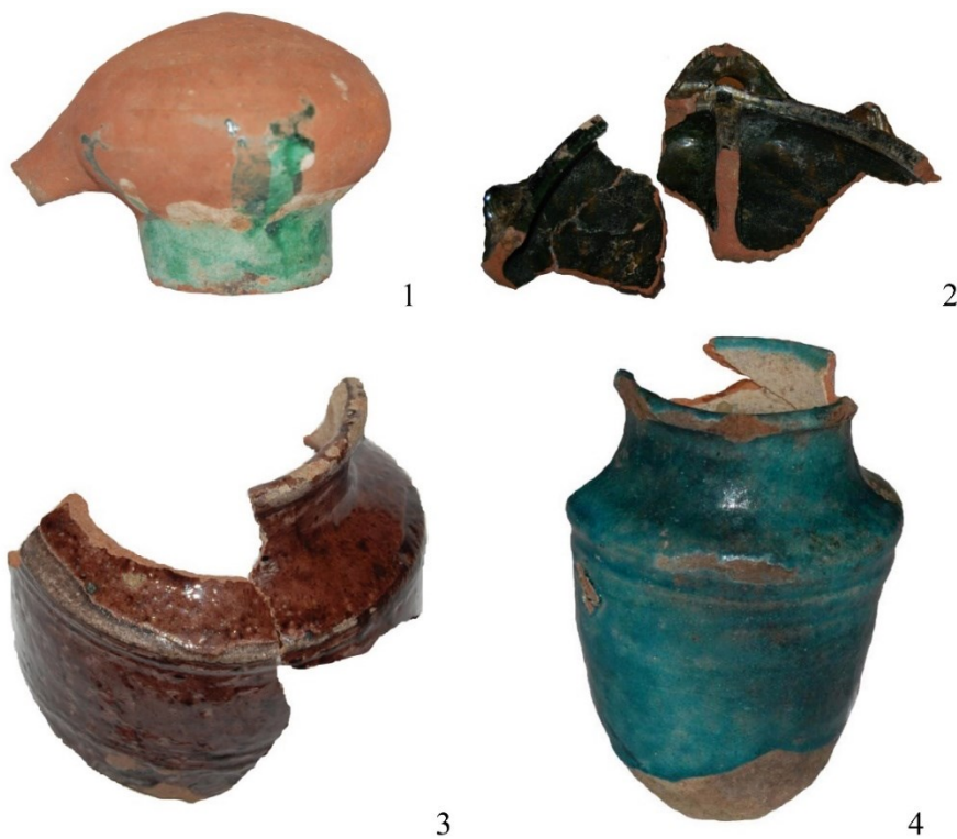
Şəkil 3 Əczəxanadan tapılan bəzi saxsı qab nümunələri

daxilində suyun paylanması təmin edirdi. Ovdan tipli hidrotikinti də su təchizatı ilə əlaqəli maraqlı tikinti qalıqlarındandır. Şəhər abadlığının təminatı ilə bağlı digər istiqamət şəhərin sanitariya-gigiena durumunun nəzarətdə saxlanması idi. Arxeoloji qazıntılar zamanı saxələnmiş ümumşəhər kanalizasiya şəbəkəsinin üzə çıxarılması Şəmkirdə sanitariya-gigiena durumunun sağlamlaşmasına yönəlmiş mühəndis qurğularının inşasının diqqət mərkəzində olduğunu təsdiqləyir (3, s. 92-93).