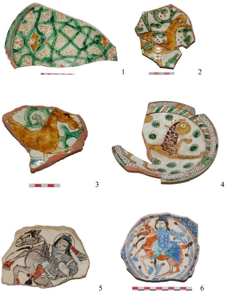
Şəkil 4 . Şirli keramika nümunələri: 1-4- şirli polixrom saxsı qab nümunələri; 5-6- “minai” tipli fayans qab parçaları.

Atabəyləri dövlətində əhalinin məişəti, zövq və əxlaqı, bədii idealları haqqında mötəbər mənbədir.