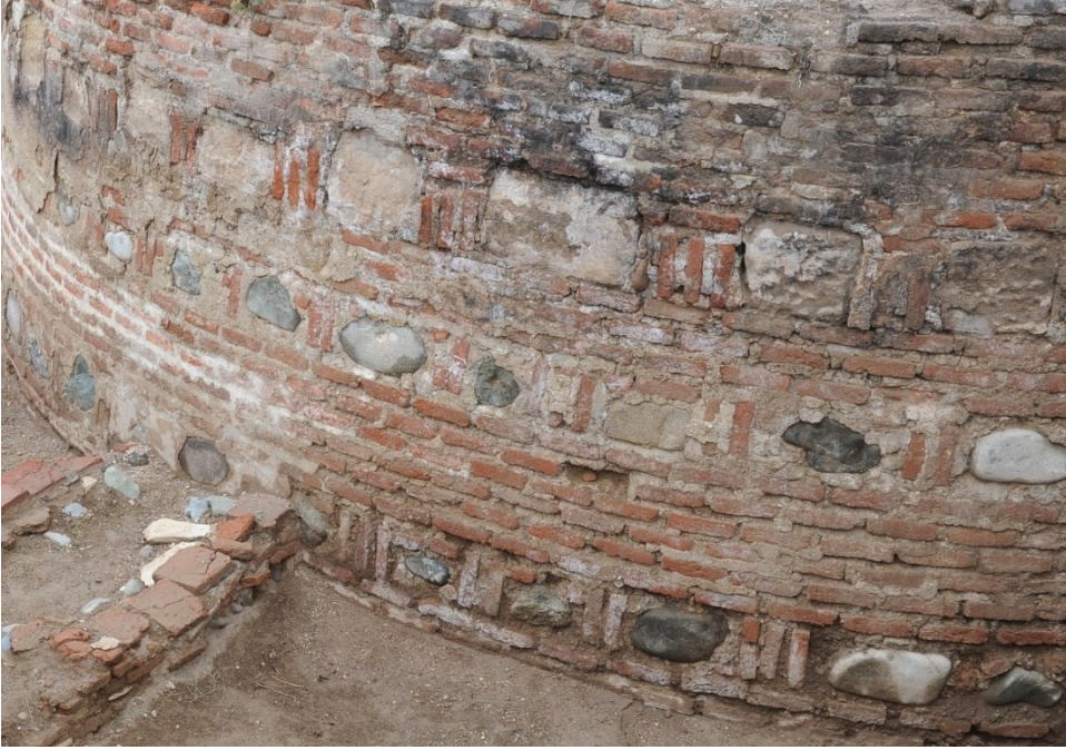
Şəkil 2 Narınqalanın cənub divarındakı bürcün hörgüsü.

arxeoloji tədqiqi zamanı əczaxana üçün səciyyəvi olan avadanlıq, həmçinin nəbati qalıqlar tapılıb. Əczaxanada cövhərin çəkilməsində, distillə prosesi üçün istifadə olunan ənbiqlərdən biri, demək olar ki, tam salamat qalmışdı (şəkil 3: 1). Sferokonuslar, boğazında havalandırma üçün kiçik deşiyi olan saxsı qablar, albarello tipli qablar, arakəsmə divarla iki hissəyə ayrılmış şirli saxsı qazan nümunəsi də əczaxana üçün səciyyəvi avadanlıqdır (şəkil 3). Tapıntılar arasında dərmanların hazırlanması və qablaşdırılmasında istifadə olunmuş şüşədən kolba və dərman qablarının fragmentləri də çoxdur. Kompleksin tədqiqi zamanı aşkarlanmış kömürlənmiş nəbati qalıqlar müalicəvi xassələrə malik olub orta əsrlərdə dərmanların hazırlanmasında xammal kimi istifadə edilirdi.