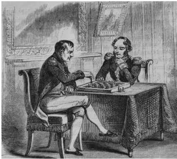
Napoleon Müqəddəs Yelena adasında

Bu sonuncu matç ərəfəsində bu kafedə P. Morphy taxtaya baxmadan bir dəstə şahmatçı və həvəskarlarla seans keçirmişdi. Voltaire, J-J Rousseau, D. Didro, Franklin, M. Robespierre, Napoleon Bonaparte, İ. Turgenev bu kafedə şahmat oynamış, K. Marx ("Marks") və F. Engels burada tanış olmuş, ömürlük dosta və həmkara çevrilmişdilər.