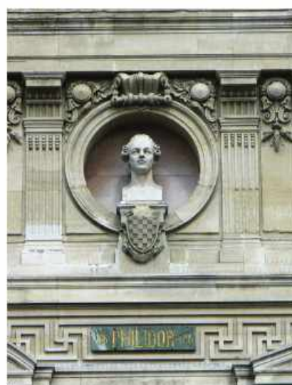
Paris Garnier Opera Teatrında büstü