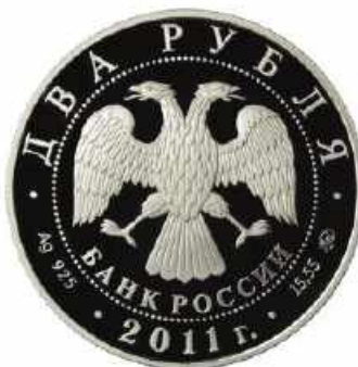
100 illiyinə (2011) Rusiya Bankının xatirə sikkəsi

6-cı dünya çempionu, Sovet şahmat məktəbinin "patriarı" Mixail Botvinnik (1911-1995) elektrik mühəndisi və kompüter elmləri üzrə mütəxəssis, texniki elmlər doktoru, professor idi. Elektrik maşınları və generatorlara aid elmi iş görürdü, asinxronlaşmış sinxron maşınlar üzrə işi ilə yüksək elmi nüfuz qazanmışdı (M.M. Ботвинник. Асинхронизированная синхронная машина. Госэнергоиздат, 1960). O, şahmat oynayan kompüter ideyası, mürəkkəb vəziyyətdə düzgün gediş tapmaq algoritmi üzərində çalışmışdı (M.M. Botvinnik Алгоритм игры в шахматы, Москва Наука, 1968). Botvinnik'in metodu ayrılmış vaxtda baxılan variantların sayını azaltmaq, yəni, mümkün variantların mühüm sayılmayan bir qismini yaddan çıxarmaq ideyasına əsaslanmışdı. Bu maraqlı algoritmi, təəssüf ki,