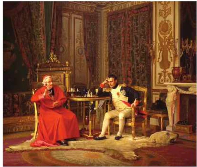
"Napoleon və Cardinal". Jean-Georges Viber'ə məxsus rəsm