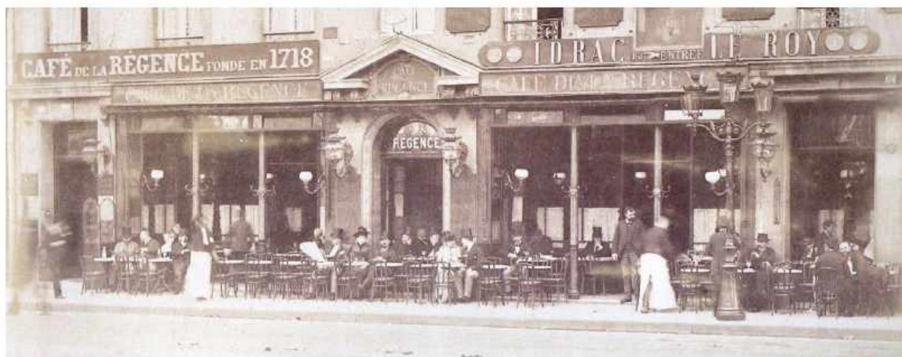
La Regence kafesi