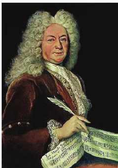
François-André Danican Philidor

François-André Danican Philidor (1726-1795) – dövrünün bu ən güclü şahmatçısı 18-ci əsr opera tarixində iz buraxmış bəstəkardır. Philidor musiqi ənənəsi olan tanınmış nəslin nümayəndəsi olub. 6 yaşından Versailles`də (Versalda) kral xorunda oxuyan Philidor orada şahmat oynayan musiqiçilərdən şahmat öyrənmişdi. 12 yaşında ilk musiqi əsərini – çoxsəslı vokal motet`ini bəstələmişdir. Philidor tezliklə musiqi dərsləri verməyə başlamış, 1753-cü ildən ömrünün sonunadək ciddi musiqi əsərləri üzərində işləmiş, o cümlədən, çoxsaylı (30-a yaxın) opera yazmışdır. Philidor`un məşhur musiqi əsərləri arasında Ernelinde, princesse de Norvège (1767) adlı lirik-tragedik operası və Tom Jones (1765) operasını (librettosu Henry Fielding`in eyni adlı romanı (novel) əsasında işlənmişdi) göstərmək olar. Tom Jones müxtəlif dillərə tərcümə olunmuş və müxtəlif ölkələrdə oynanılmışdı. Philidor`la yarışmalı olan bir musiqiçinin sevgi hekayəsi əsasında yazılmış bir akth Battez Philidor! ( Philidoru ud! )