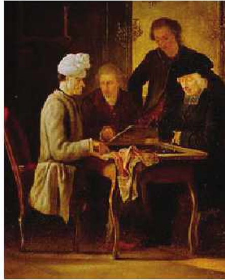
Adam ata ilə şahmat oynayan Voltaire