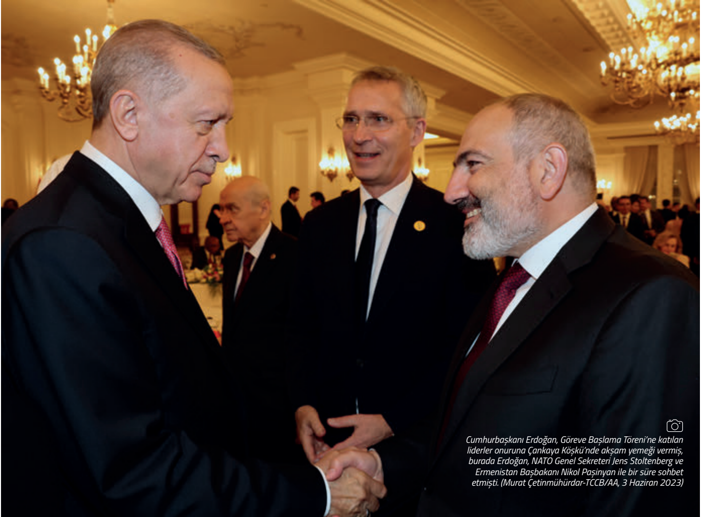
Cumhurbaşkanı Erdoğan, Göreve Başlama Töreni'ne katılan liderler onuruna Çankaya Köşkü'nde akşam yemeği vermiş, burada Erdoğan, NATO Genel Sekreteri Jens Stoltenberg ve Ermenistan Başbakanı Nikol Paşinyan ile bir süre sohbet etmişti.

Sonuç olarak, BM Güvenlik Konseyi'nden dahi "Bakü'yle konuşun" çıktısı düşünüldüğünde, barış anlaşmasının uzak olmadığını ifade etmek mümkündür. K