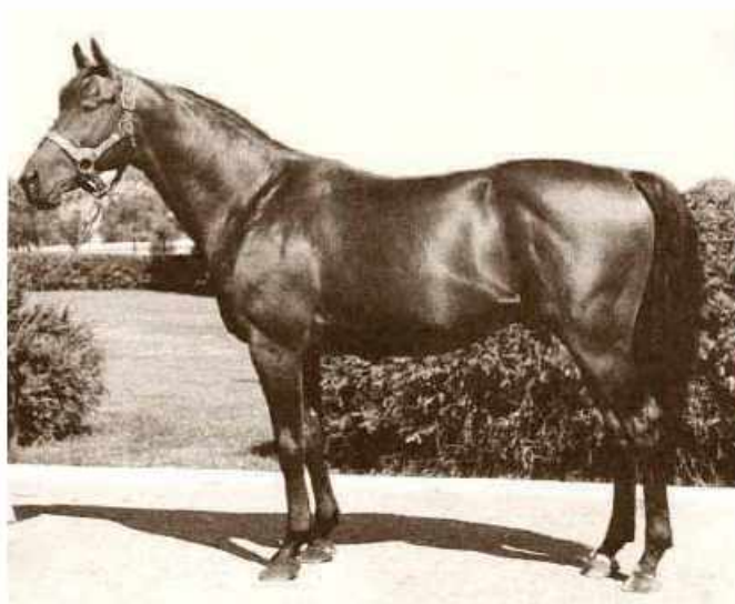
Citation adlı at