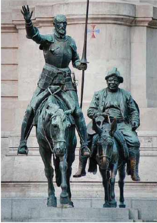
Don Quixote və Sancho Panza. Müəllif: Lorenzo Coullaut-Valera. Madrid