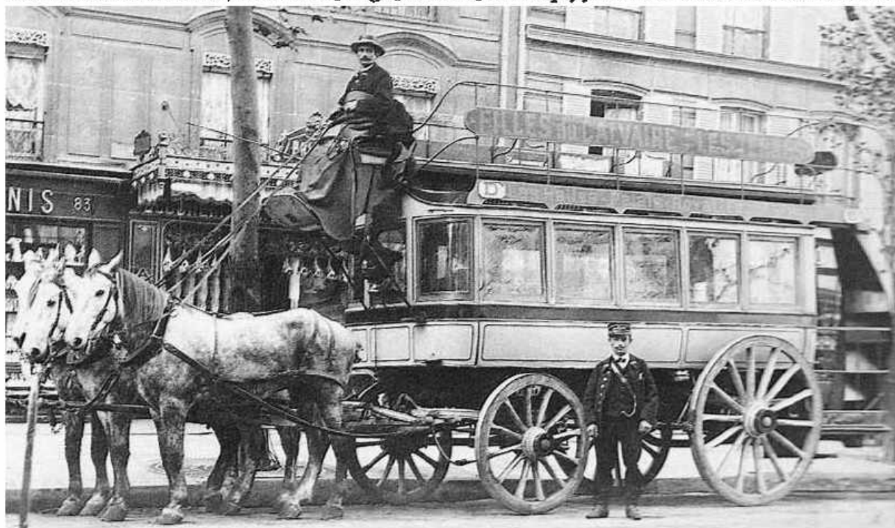
Omnibus. 1890-cı il

Daşıma və minik üçün atdan başqa eşşək, dəvə, öküz və fillərdən istifadə olunurdu. Səhrada minik və yükdaşımada dəvə birinci, at ikinci rol oynadı. James Watt'un (1736-1819) elmə və texnologiyaya daxil etdiyi "At gücü" termini atın insan həyatında oynadığı böyük rolun təcəssümü kimi şərh oluna bilər. Watt buxar maşınının gücünü yük-qoşqu atlarının xüsusi seçilmiş dəyirman təkərini döndərmə gücü ilə ölçürdü. Buxar maşınları dövrü əslində ata ehtiyacı çox artırırdı. Fabrik, ferma və bazarlara və oradan tələb olunan yerlərə daşıma, un dəyirmanlarının işləməsi, otun biçim və yığılı, fayton, kanal qayıqları və omnibusların hərəkəti atlar vasitəsilə təmin edilirdi. Omnibus (ingiliscə Horsebus və ya Horse-drawn omnibus) atların daşdığı çoxsərnişinli nəqliyyat vasitəsi idi, onu avtobusların