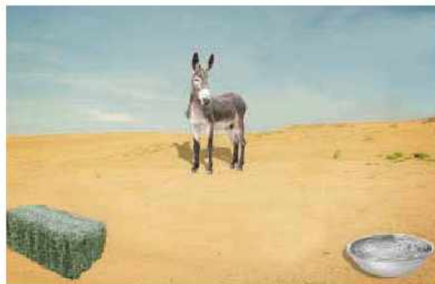
Buridan eşşəyinin təsviri

2. Buridan eşşəyi adlı çox populyar bir deyim var. Eyni dərəcədə ac və susuz eşşəyin qabağına ondan eyni məsafədə duran vedrədə su və bir qıcaq ot qoyulub. Eşşək su ilə ot arasında seçim edə bilmir, nəticədə o qədər tərəddüd edir ki, susuzluqdan və acından ölür. Əslində bənzər paradoks Buridan`dan çox-çox əvvəl yaşamış Aristotel`də və Əl-Qəzali`də var. Aristotel “Göylər haqqında” ( On the Heaven, 259b ) əsərində yazır ki, eyni dərəcədə həm ac və həm də susuz olan adamın qarşısına yemək və su qoyulsa, o, hansından başlayım deyər tərəddüd içində qalıb ölə bilər. Əl-Qəzali`də isə belədir: Adamın qarşısında eyni dərəcədə yaxşı iki xurma varsa, o, onlardan birini – insan təbiətinə görə daha keyfiyyətini götürmək istəyəcək. Bunun üçün düşünməli olacaq ( Abu Hamid al-Ghazali, The Incoherence of the Philosophers. 2000. p. 23 ). 14-cü əsr fransız filosofu Buridan`ın adı ilə bağlı olan rəvayətdə isə adam eşşəklə əvəz olunub. Bu paradoks fəlsəfənin “azad iradə” probleminə uyğundur və Buridan`ın əsərləri arasında onun adı ilə şöhrətlənən bu eşşək məsələsi yoxdur; o, sadəcə, azad iradə məsələsində insan daha xeyirli olanı seçməyə çalışacaq demişdir. Buridan misalına adamın əvəzinə eşşəyi kimin gətirdiyini bilmirəm.