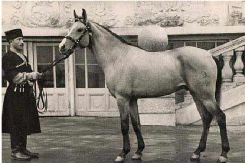
1956-cı ildə 2-ci Elizavetaya hədiyyə olunan "Zaman" adlı Qarabağ atı

Azərbaycanda 18-19-cu əsrlərdə Qazaxda yetişdirilmiş at cinsi Dilbaz və ya Qazax atı kimi tanınmışdır. Bu cinsin təkamülündə Qarabağ və ərəb atlarının iştirakı ilə cütləşmələrdən istifadə olunmuşdur. S. Vurğun "Əlim tərpenməmiş oyna yerindən" misrası ilə başlayan "A köhlən atım" şeirində, çox güman ki, mindiyi Qarabağ və ya Qazaxın Dilbaz atını vəsf edirdi.