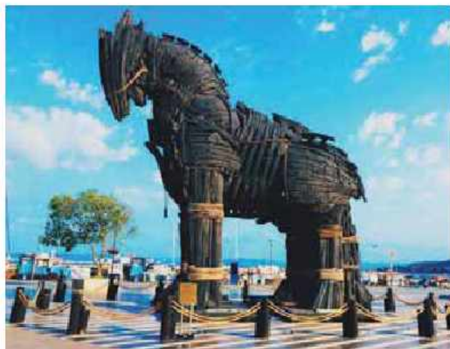
Troya atı abidəsi. Çanakkale, Türkiyə

Makedoniyalı İsgəndər'in Bukefalos adlı atı da tarixi məşhurlar sırasındadır. Plutarx İsgəndər'in həyat tarixçəsində bu at barədə maraqlı rəvayət danışır. Makedoniya kralı Filipp'ə satmaq üçün təqdim olunan Bukefalos qəşəng, amma ipə-sapa yatmayan vəhşisayaq at idi və heç kimi yaxın qoymurdu (Bukefalos "öküzbaş" deməkdir). 12-13 yaşlı İsgəndər bu şıltaq atı ram etməyə girişdi. O, başqalarının görmədiyi bir şeyi - atın öz kölgəsindən ürkdüyünü müşahidə etmişdi və yüyənindən tutub atın başını günəşə doğru yönəltdi ki, o, öz kölgəsini görməsin. Atı əli ilə sıgallaya-sıgallaya bir qədər onun yarı ilə qaçan İsgəndər nəhayət atın belinə sıçradı və atın başını döndərərək onu qürurla atası Filipp'in qarşısına sürdü. Oğlunun igidliyindən iftixar hissi duyan Filipp dedi: "Oğlum, sən özünə bərabər və layiq bir səltənət tap, çünki Makedoniya sənə üçün çox kiçikdir." (Plutarx, «Александр», 6, Сравнительные жизнеописания в двух томах).