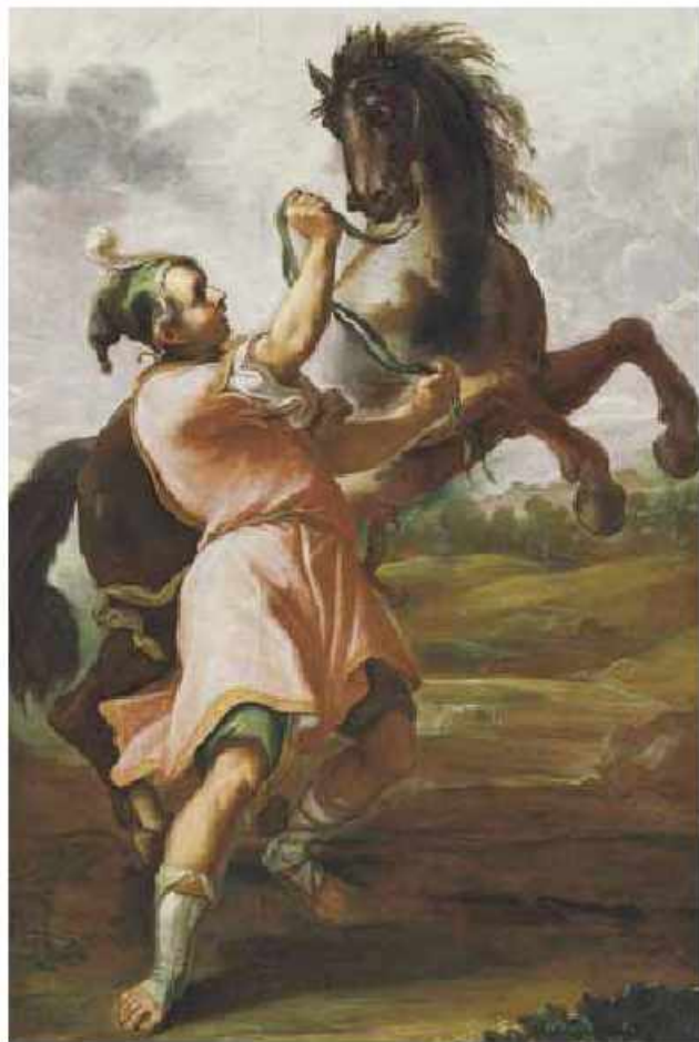
İsgəndər və Bukefalos. Müəllif: Domenico Maria Canuti. 17-ci əsr