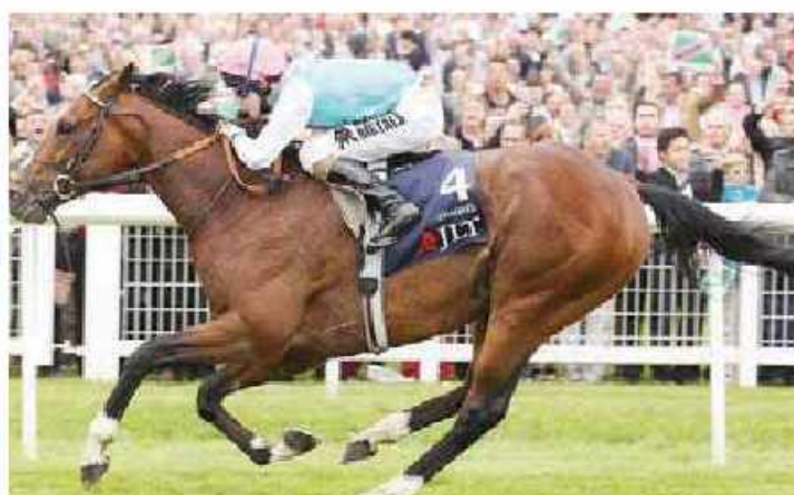
Frankel adlı at