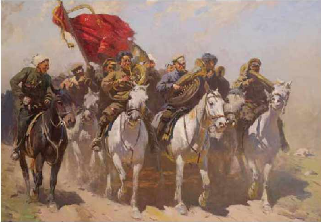
Birinci Süvari Ordusunun trubaçıları. Müəllif: Mitrofan Grekov. 1934