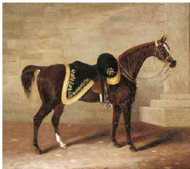
Hersoq Wellington`un Copenhagen adlı atı. Müəllif: Samuel Spode

Napoleonun atı isə savaşda ingilislərin əlinə keçdi, hazırda onun skeleti London National Army muzeyindədir. Yeri gəlmişkən, Waterloo döyüşündə külli miqdarda at itkisi baş vermişdi (azı 10 min, 40 minə yaxın dəyənlər də var). Ölən, yaralanan və əsir düşən insan itkisi fransızlarda 40 minə yaxın, Britaniya-Prussiya ittifaqında isə 22 min ətrafında olmuşdu.