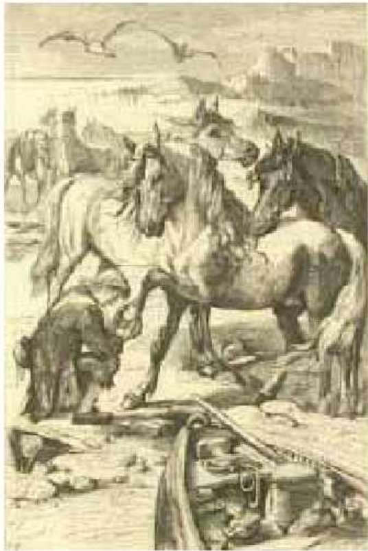
Gulliver Houyhnhnmlar diyarında

Miguel de Cervantes'in (1547-1616) dünya ədəbiyyatının şah əsərlərindən olan "Don Quixote" (Don Kixot, 1605) romanı onun baş qəhrəmanı, qəribə cəngavər Don Kixot'un başına gələn macəralardan bəhs edir. Don Kixot həmişə özünə yaxın sadə adam – eşşək belində gəzən Sancho Panza və özünə oxşar görünüş və xasiyyətə malik yöndəmsiz, yaşlı və yorğun at – Rocinante (Rosinante) ilə birlikdədir.