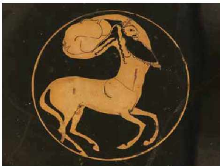
Eradan əvvəl 510-500-cü illərə aid Kentavr təsviri. Vatikan muzeyi. Roma

Qədər in cəlvəsinə bax –Amerika mənşəli at Amerikanı tərk etdi və əhliləşmiş at Amerikaya ancaq 16-cı əsrdən başlayaraq bu qitəni kəşf və istila edən avropalılarla gəldi. İspaniyalı konkistador, kolonizator Hernán (Hernando) Cortés (1485-1547) indiki Meksika ərazisində yerləşən Aztec dövlətini fəth edərkən döyüşçülərinin mindikləri atları yerlilər möcüzəli güc, at və süvarini birləşmiş məxluq sayır, süvarilərin açdığı atəşi atın ağzından alov püskürməsi kimi qəbul edirdilər. Yəqin ki, çox qədimlərdə yunanlar da, sonralar Aztecədə olduğu kimi, ilk dəfə süvariləri görəndə onları bədəninin yuxarı hissəsi insan, aşağı hissəsi və ayaqları at olan məxluqlar, insan-at və ya at-insanlar sanmış, onlara kentavr adı verib əfsanələşdirmişlər. Kentavrlar fiziki cəhətdən insanlardan güclü olmaqla ağıllı məxluqlar sayılmış, həm zor işlətməyi sevmiş, həm də cəngavər ola bilməmişlər.