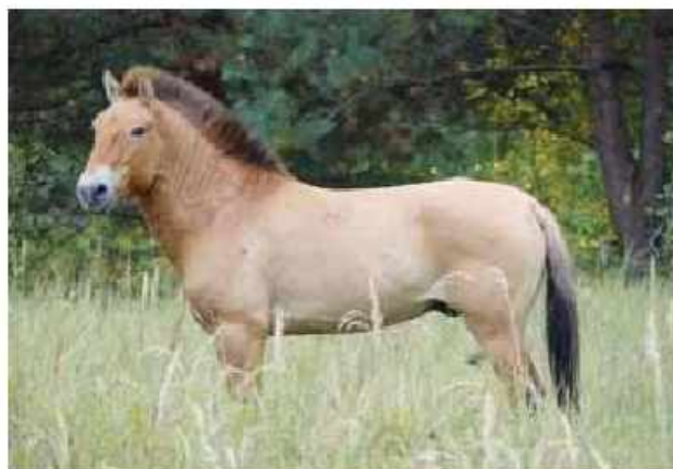
Çernobil təcrid zonasında Prjevalski atı

Vəhşi atların növləri haqqında xüsusi söhbət açmıram. 1878-1881-ci ildə tapılıb təsvir edilmiş Prjevalski atı hazırda mövcud olan yeganə vəhşi at növüdür. Digər vəhşi atların kökləri kəsilməmişdir. Türklər tərəfindən "Tarpın" adı verilmiş vəhşi atların sonuncusu 1909-cu ilə aiddir. Boyu, bədən uzunluğu və ayaq uzunluğu ev atlarından daha qısa olan Prjevalski atı ilə ev atlarının fərqli əcdadlardan törədikləri qəbul olunmuşdur. Ev atı 32 cüt, Prjevalski atı isə 33 cüt xromosoma malikdir. Prjevalski atı ilə yanaşı taxı, Mongol vəhşi atı və ya Junqar vəhşi atı adları da işlənir. Vəhşi Prjevalski atlarını indi təbiət qoynunda deyil, ancaq zooparklarda və bəzi yarıqoruq kimi yerlərdə görmək mümkündür.