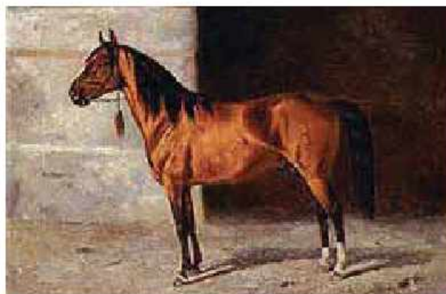
Xan adlı Qarabağ atı. Müəllif: Nikolay Sverçkov 1865

Qarabağ atının yerli türkmən, Axal-təke və ərəb atlarının iştirakı ilə yetişdirildiyi deyilir. Qarabağ xanlığının qurucusu Pənahəli xan (1693-1763) vaxtından üzü bəri Qarabağda atçılıq inkişaf etmişdir. Pənahəli xanın oğlu İbrahimxəlil xan (1732-1806) böyük at həvəskarı idi, at yetişdirilməsinə xüsusi fikir verirdi. Sonuncu Qarabağ xanı Mehdiqulu xan (1763-1845) bu işə əhəmiyyət vermədi, lakin onun qızı Xurşidbanu Natəvan xanım (1832-1897) Qarabağ atlarının yetişdirilməsi və tanıtılması ilə həvəslə məşğul olmuşdur. 19-cu əsrdə Qarabağ atları dünya sərgilərində medallar və fəxri fərmanlara layiq görülmüşdür. Qarabağ atları, onların xüsusiyyətləri, istifadəsi və şöhrəti haqqında Avropa, Asiya və Rusiyada diplomatlar, səyyahlar, şair və