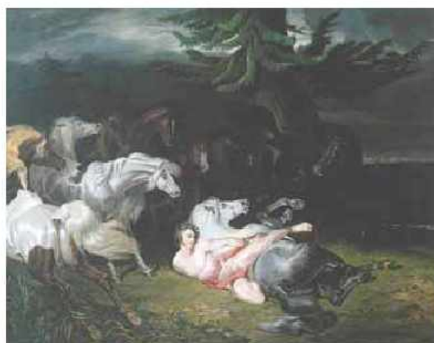
Mazeppa atların əhatəsində. 1833. Müəllif: John Frederick Herring I. Tate Gallery

Ukraynalı Hetman Mazeppa'nın (1639-1709) belə macəralı sevgisi və çılpaq şəkildə ata bağlanması barədə rəvayəti təsdiq edən heç bir tarixi sənəd yoxdur. Byron'un Mazeppa'sı, xüsusilə çılpaq adamın at belində uzun və təhlükəli səfər həyəcanı şair, yazıçı və jurnalistlərə,