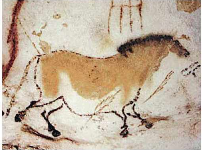
Lascaux mağarasında Üst Paleolit dövrünə aid at təsviri. Fransa

Təqribən 17 min il əvvələ aid edilən Lascaux mağara divarlarında qədim rəssam vəhşi at şəkli çəkmişdir. (-1400) -cü illər ətrafında Mitanni adlanan ərazidə (Cənub-şərqi Anadoluda) Kikkuli adlı müəllif Hitit (Het) dilində atlılıq haqqında, döyüş arabaları üçün atların təlimi barədə ətraflı kitab yazmışdır. Sokrat'ın tələbəsi Ksenofon və Arrian atları saxlama və təlim etmə, onlarla necə düzgün rəftar etmə, döyüşə necə hazırlama barədə bələdçi kitablar yazmışlar. Herodot, Pliny, Strabon kimi antik dövr tarixçi, coğrafiyaçı və ensiklopediyaçıları vəhşi atlardan bəhs etmişlər.