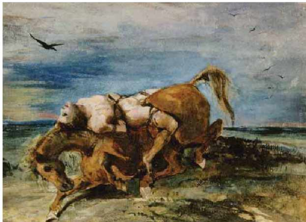
Mazeppa ölməkdə olan atın üstündə. 1824. Müəllif: Delacroix

cəsədi ilə kef çəkməyə hazırlaşan qarğanı görür. Huşunu itirən Mazeppa oyananda özünü yataqda görür, yaralarını "kazak qız" müalicə edir. Qəhrəman at ölmüş, qəhrəman Mazeppa xilas edilmişdir. Mazeppa söhbəti bitirir və yatmaq üçün yatağını hazırlayır, Kral artıq bir saat vardı ki, yatmışdı.