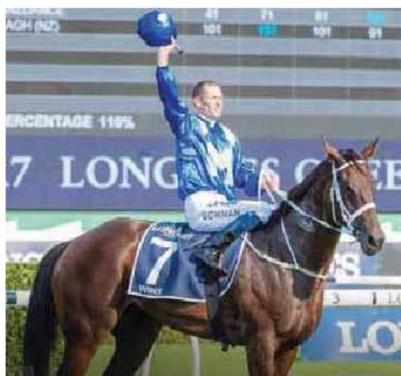
Winx adlı at