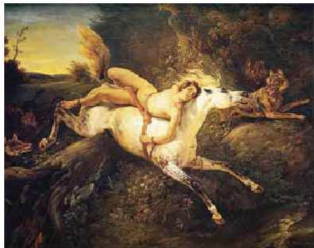
Mazeppa və Canavarlar. 1826. Müəllif: Horace Vernet. Calvet Muzeyi, Fransa