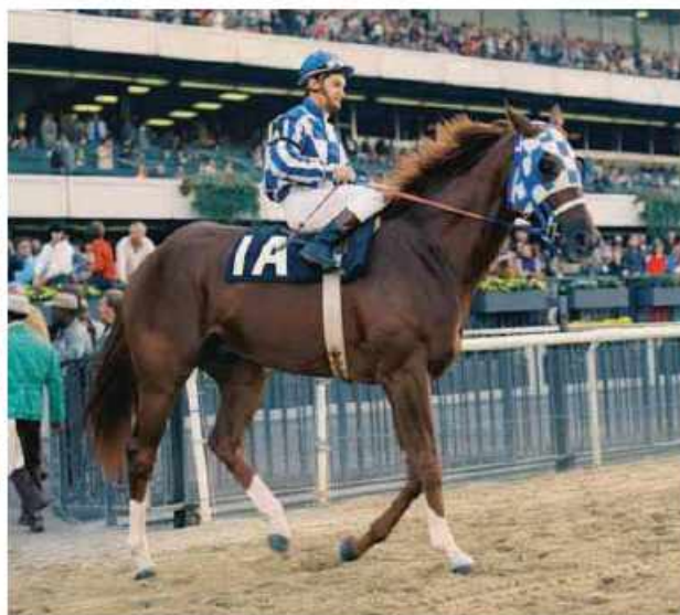
Secretariat adlı at