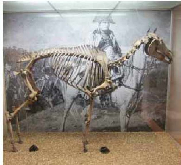
Napoleon`un Morengo adlı atının skeleti. National Army Museum. London