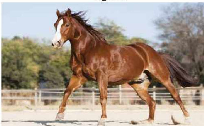
Amerikan Quarter Horse atı