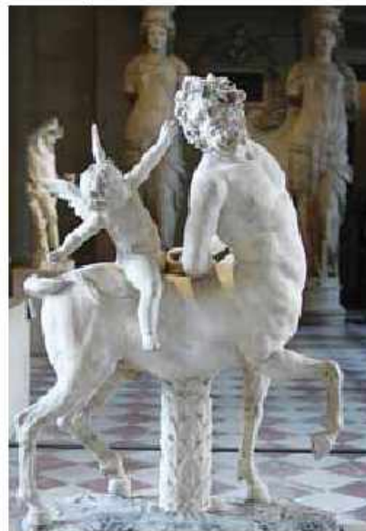
1-2-ci əsrlərə aid Kentavr heykəli. Luvr muzeyi. Paris