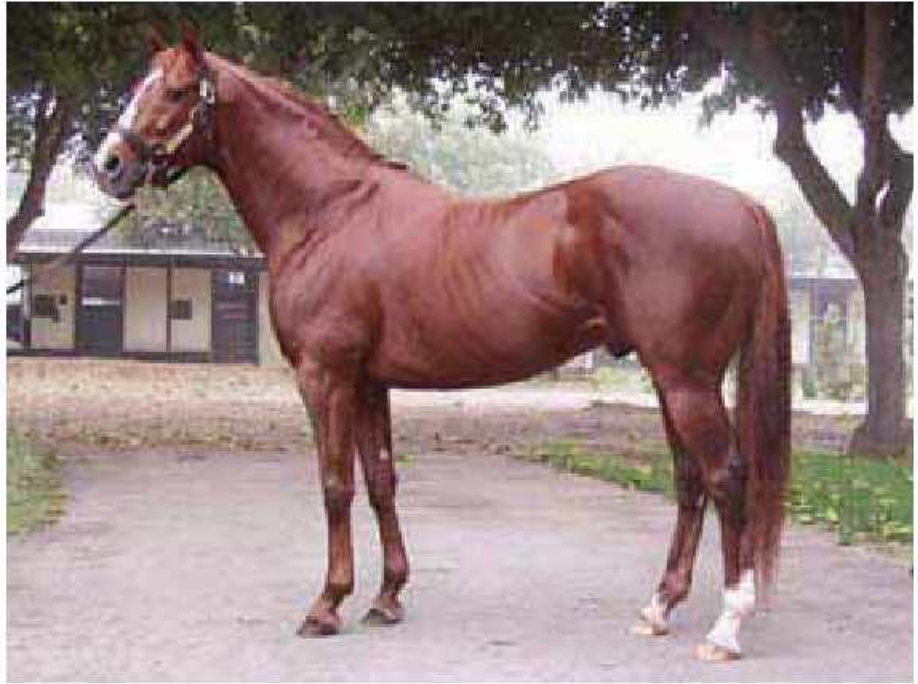
Thoroughbred cinsi at