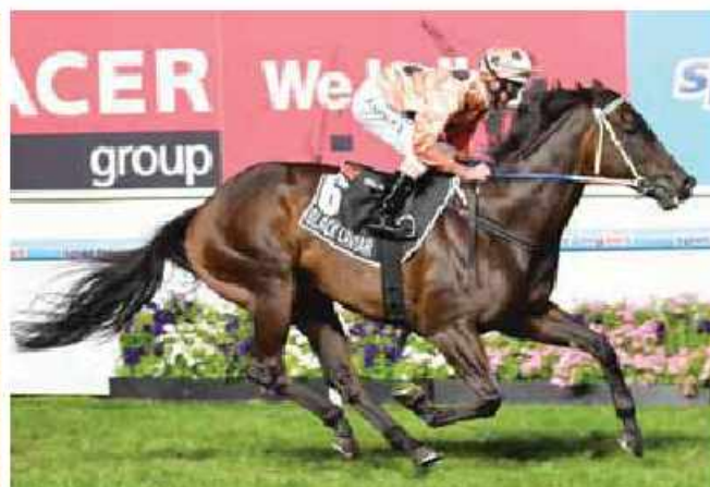
Black Caviar adlı at