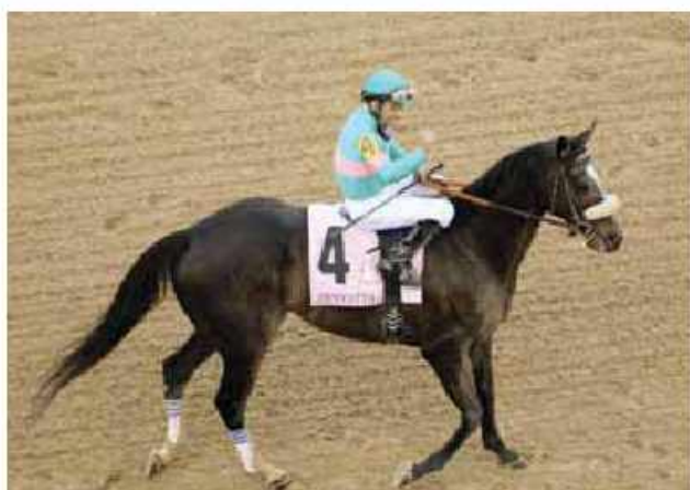
Zenyatta adlı at