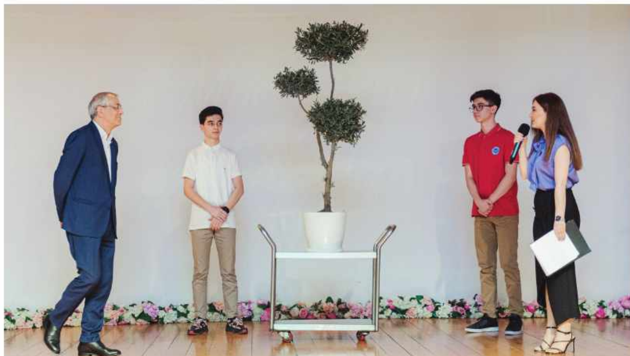
"Dünya" məktəbinin hədiyyəsi