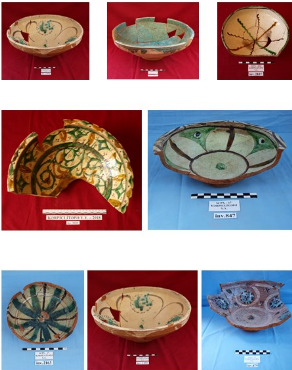
Şəkil 6. Şirli boşqab və xeyrələr