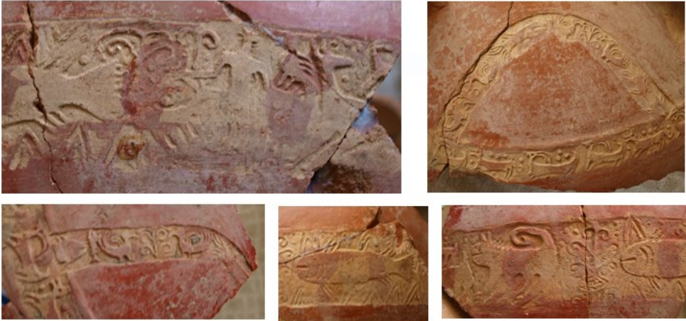
Şəkil 5. Qablar üzərindəki relyefli ornamentlər