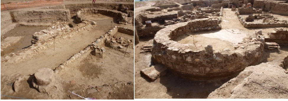
Şəkil 1. Qala bürcü.

rından istifadə edilməklə ucaldılmış tikililər, yüksək alqı-satqı münasibətlərindən xəbər verən sikkə bolluğu və savadlılığın göstəricisi olan “mürək-kəbqabıların” (onlar ən çox orta təbəqələrdə aşkar edilmişlər) bu abidənin kənd tipli adi yaşayış yeri deyil, bəlkə də qəsəbə tipli yaşayış məskəni və ya qəsir-malikanə olduğunu söyləməyə əsas verir.