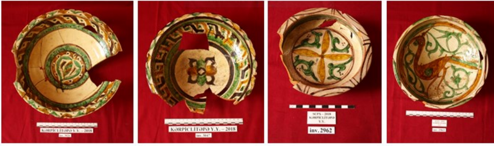
Şəkil 3. Həndəsi, nəbati və zoomorf təsvirli şirli kasalar