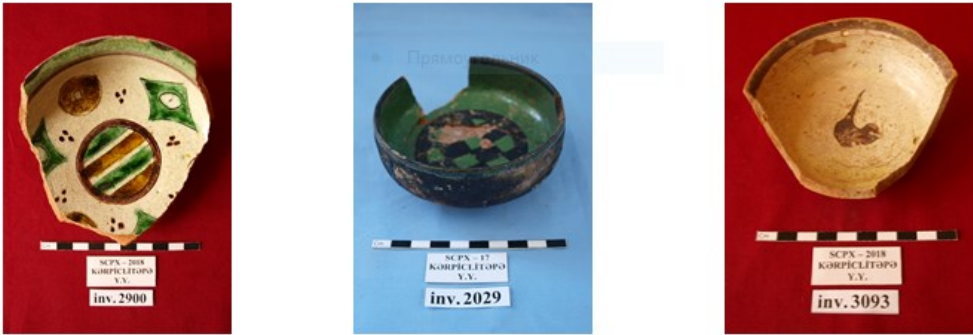
Şəkil 4. Gil piyalələr