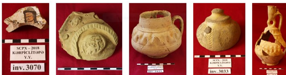
Şəkil 11. Antropomorf təsvirli qabdan fraqment, basma naxışlı qabdan fraqment, relyefik naxışlı parç, sferik qab, qrafın