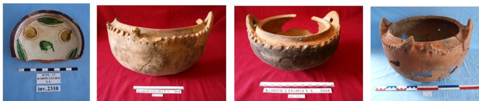
Şəkil 7. Nəlbəki, gil qazanlar