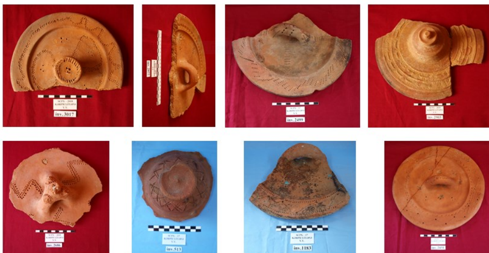
Şəkil 9. Mürəkkəbqabılar