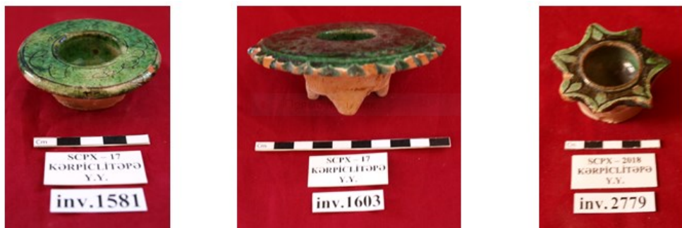
Şəkil 10. Gil qapaqlar