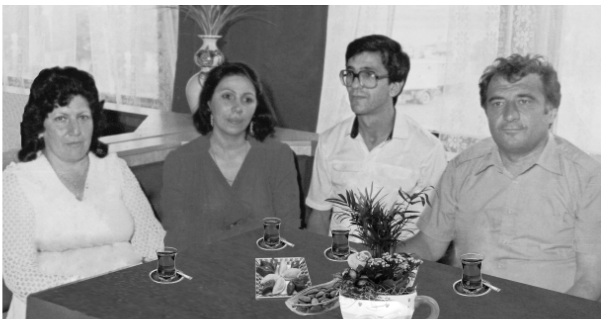
İki dost ailə