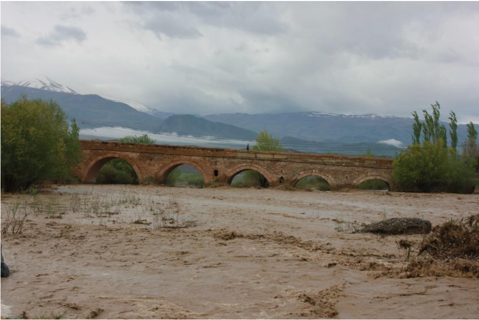
Şəkil 1. a) Mardinli artuklularından Nasirəddin Artuk Arslana (1200-1239) aid mis sikkə (1231). b) Beş tağlı Aza körpüsü