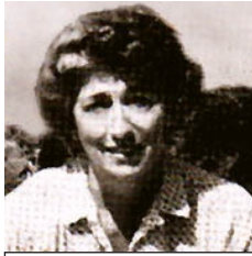
Fawn M. Brodie

Psixotariix klinik psixologiyadan fərqli olaraq klinikaya deyil, sənədlərə söykənir. Lakin çox zaman şəxsi xarakter daşıyan bu sənədləri psixanaliz metodları ilə öyrənmək lazım gəlir. Amerika qadın tarixçisi Fawn M. Brodie (1915-1981) də Thomas Jefferson haqqında qələmə aldığı əsrlə 11 psixoloji portret janrının ən tanınmış nümunələrindən birini meydana gətirmişdi.