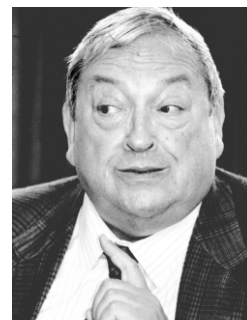
Jacques Le Goff

Psixososial inkişaf nəzəriyyəsinin banisi sayılan Erik Erikson (1902-1994) psixotarix, xüsusilə psixosanalitik bioqrafiya sahəsində də ən usta yazıçılardan biridir. Mühitin və şəxsi həyatda baş verən ciddi dəyişmələrin nəticəsində insan kimlik böhranı keçirə bilər, şəxsiyyət sanki haçalaşır, insan sanki ikinci dəfə doğulur, dünyaya yenidən gəlir. Onun “Gənc Luter. Psixosanalitik tarixi araşdırma 10 ” əsəri bu yöndə yazılmış ən sanballı əsərlərdən biri hesab edilir. Erikson da Freud kimi şəxsiyyətin formalaşmasında uşaqlığın həlledici rol oynadığı fikrində idi. O, psixoloji portret yaratmaq işini sonra da davam etdirdi, “Gandhi's Truth: On the